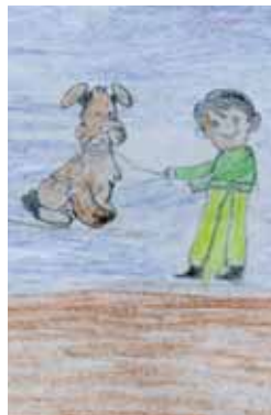
Un perro no es un juguete