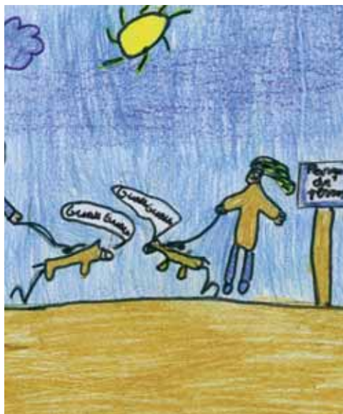
Tanta energía hace que a veces pierdan la "razón". (FOTO: Marcos Rincón; C.P. Simón de Colonia)

Existe un Registro de Animales Potencialmente Peligrosos que incluye hasta ocho razas. En este registro, además de los datos generales del perro debe constar su procedencia y las revisiones veterinarias a que es sometido. Para poseer un animal de este tipo se requiere una licencia que otorga el Ayuntamiento.