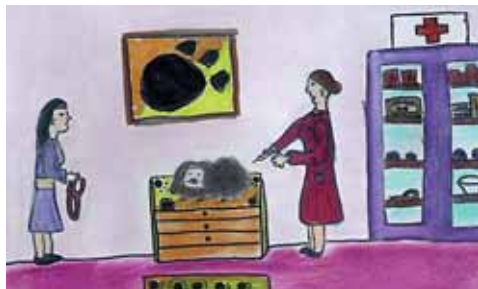
La atención sanitaria, indispensable para el animal

Según la normativa municipal, es responsabilidad del propietario tener en buenas condiciones higiénico-sanitarias a su perro. Igualmente, debe proporcionarle alimentación y atender sus necesidades de ejercicio y espacio.