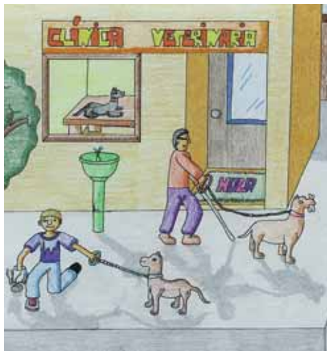
Una gran familia convive en la ciudad

Esos otros ciudadanos de cuatro patas, que también pasean por nuestras calles, y usan sus aceras y paseos, son, -ellos también-, arandinos y, por tanto, un poco responsables de que nuestra ciudad esté más limpia y sea más fácil su convivencia.