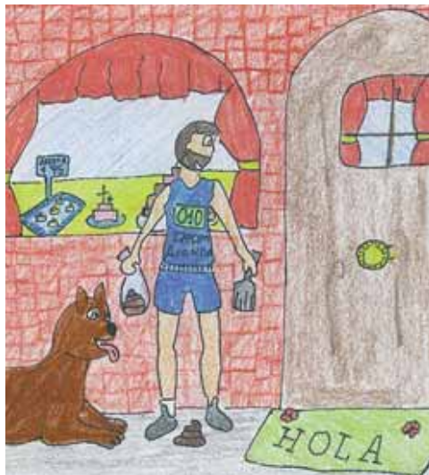
Mipo sabe que hay momentos en los que debe esperar (FOTO: Victor Diez; C.P. Santa María)