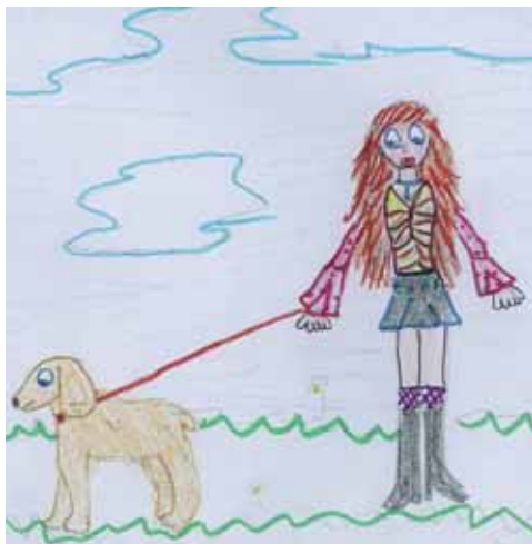
De paseo con una grata compañía

Y es muy importante que nuestra mascota no cause molestias a los vecinos. Para ello, la mejor receta es hacerle caso, sacarle a pasear y no olvidar que un perro es un ser vivo que necesita atenciones.