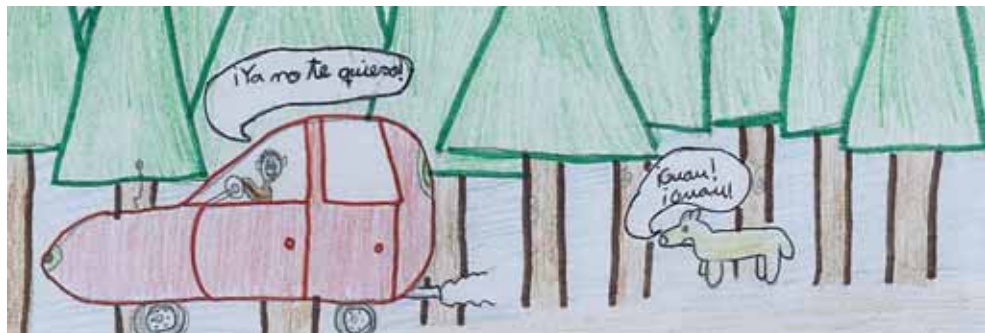
¡Eh, tú!, ¿dónde vas?. Hábrtelo pensado antes. (FOTO: Jaime Illera; C.P. Simón de Colonia)

Según la Ordenanza Municipal, quien encuentre un animal abandonado debe comunicarlo en el plazo de 5 días. En caso de ser identificado, se les comunicará a sus dueños para que antes de cinco días pase a recogerlo.