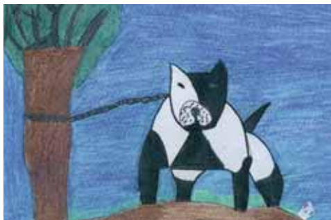
Amos responsables, perros responsables.

En casi todo el país, también en Aranda, los perros de razas consideradas peligrosas, son vistos con cautela por algunos ciudadanos. Tener un perro de estas razas supone, sobre todo, adquirir una responsabilidad cívica tanto a la hora de educarle correctamente, como a la hora de tenerle dado de alta en el Registro correspondiente y, sobre todo, evitar que pueda molestar o asustar a otras personas.