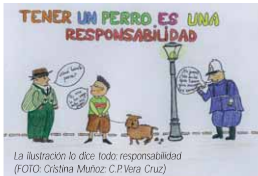
La ilustración lo dice todo: responsabilidad (FOTO: Cristina Muñoz; C.P. Vera Cruz)