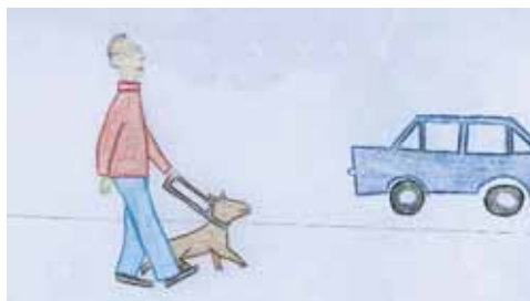
Ser perro guía es una suerte, "donde va él voy yo"